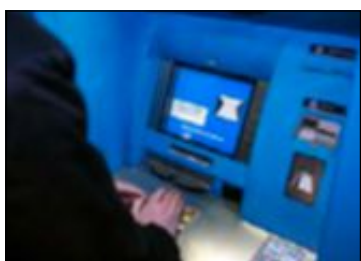
I Värmland har flera bankomater manipulerats.